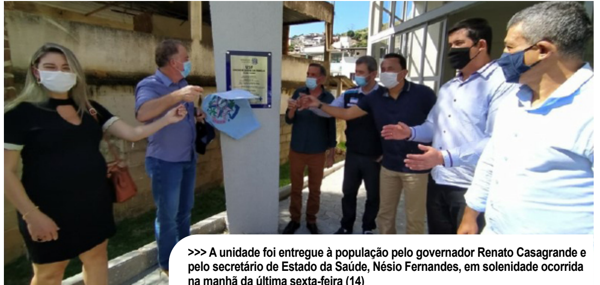
>>> A unidade foi entregue à população pelo governador Renato Casagrande e pelo secretário de Estado da Saúde, Nésio Fernandes, em solenidade ocorrida na manhã da última sexta-feira (14)

A unidade de Castelo iniciou o atendimento aos usuários na última segunda-feira (10). A média de atendimento semanal de dispensação é de 100 usuários por dia. A nova unidade terá uma estrutura padronizada, assim como as demais farmácias espalhadas estra-